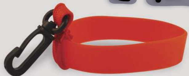
Vierge / Blank printing