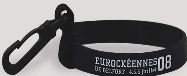
Personnalisé / Customized